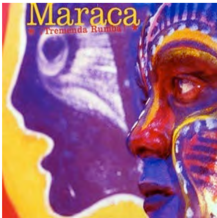
Pochette du disque de Maraca, Tremenda Rumba

Cuba en carnaval (Orlando Maraca Valle) Tremenda Rumba , Maraca, 2002 Ahinama http://www.deezer.com/album/6479989