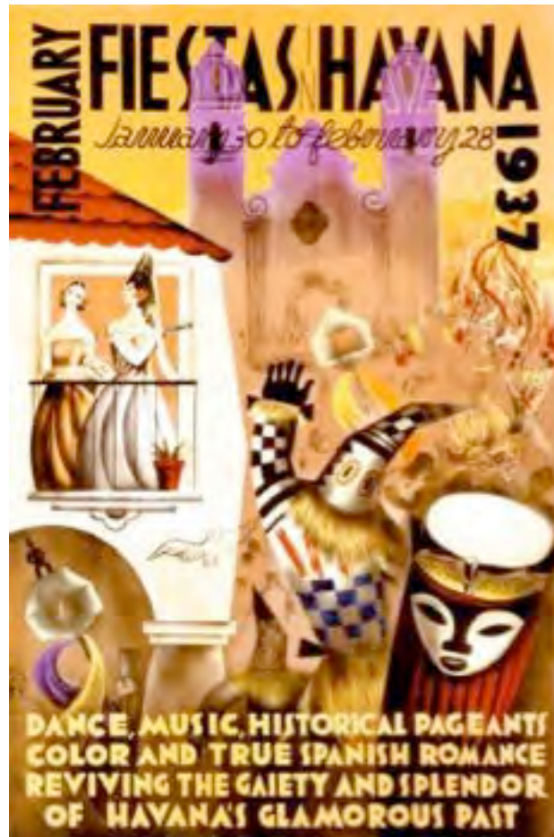
Affiche du carnaval de La Havane, 1937