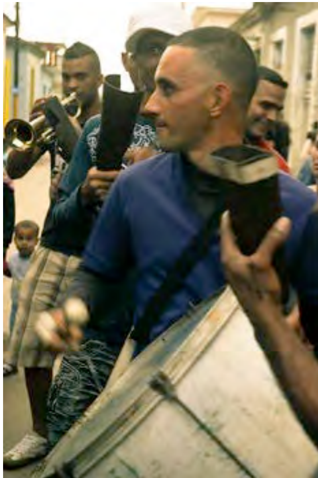
Charanga de Bejucal

Macorina (Alberto Barroso, 1910) Orquesta Sensación