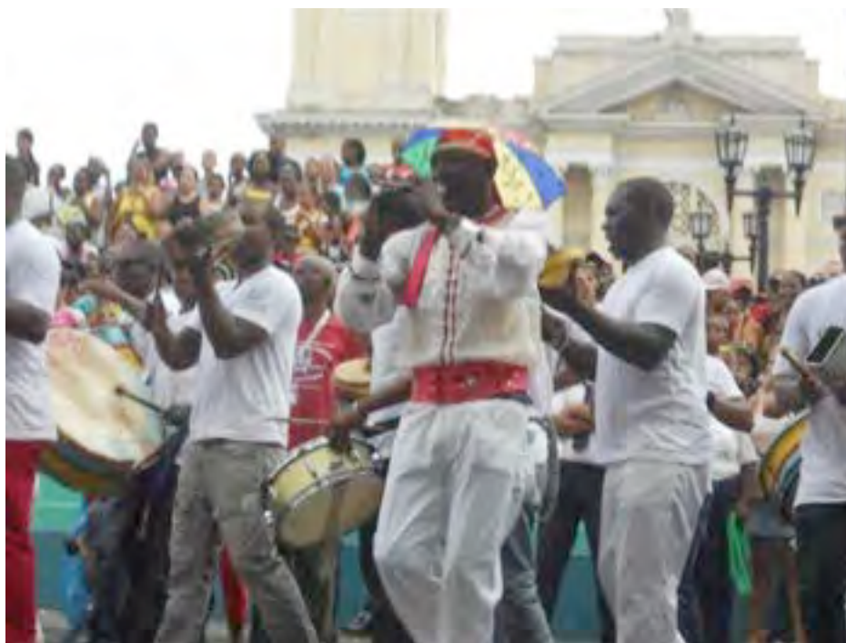
Conga de San Agustín