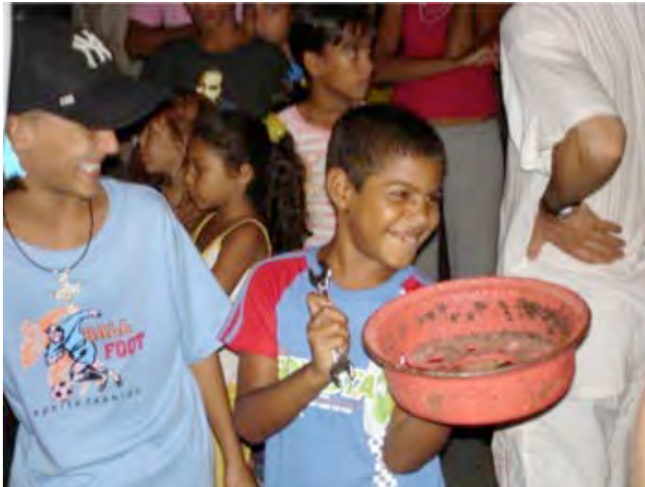
Jeune joueur de llanta au carnaval de Santiago

A vele vele vele A vele vele va A vele vele vele Yo soy un loco sin papeles