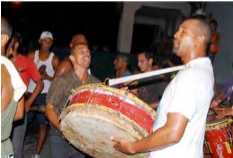
Pilonero de la Conga de Los Hoyos

Maria Cristina me quiere gobernar Y yo le sigo le sigo la corriente Porque no quiero que diga la gente Que Maria Cristina me quiere gobernar