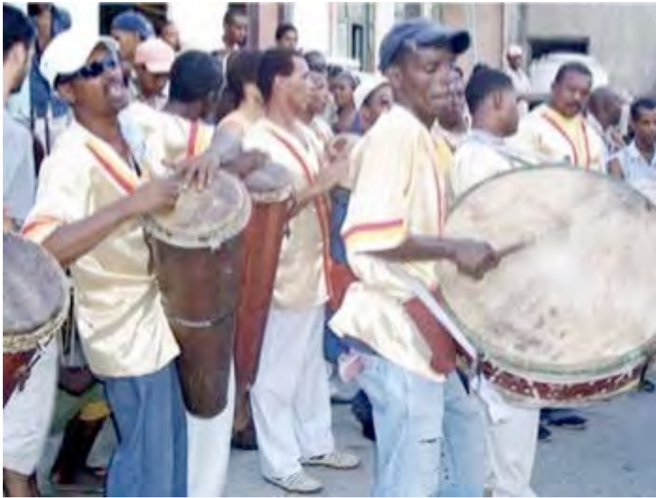
Bocú et pilon de la Conga de Los Hoyos