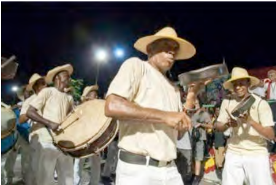
Conga de Los Hoyos

Pedimos recordando viejo tiempos (bis) Que iba mi barrio al Tivoli (bis) La conga de Los Hoyos es conocida Todos lugares del país