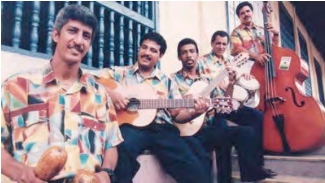
Los Guanches