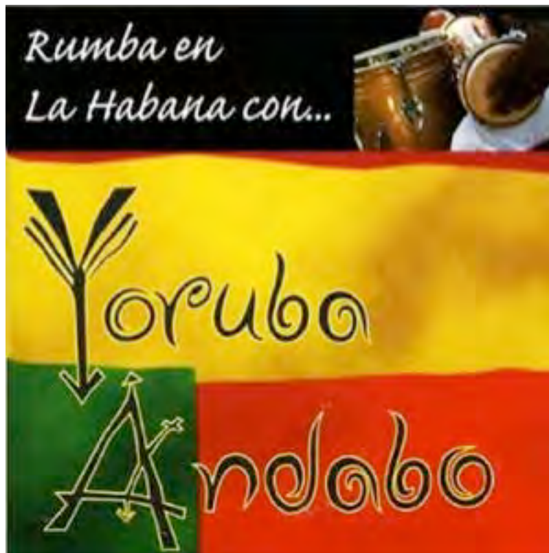
Pochette du disque Rumba en La Habana, Yoruba Andabo

Todos en la vida tenemos un caracol Cuida bien eso quien naturaleza aqui te dio Todos en la vida tenemos un caracol Caracol, caracol, todos tienen caracol Todos en la vida tenemos un caracol Mira nina mira nina tu tambien con caracol Todos en la vida tenemos un caracol Caracol, caracol todos tienen caracol Todos en la vida tenemos un caracol Caracol, caracol, caracol, caracol Todos en la vida tenemos un caracol Caracol, caracol, caracol, caracol A los mandingue, me llevan pa' la loma Caracol, caracol, caracol, caracol Para te sentir mejor cuida bien tu caracol