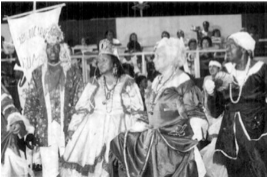
Carabali Isuama

Carabali ya se acabo Carabali ya se acabo Carabali no vuelve mas Eko, eko, eko