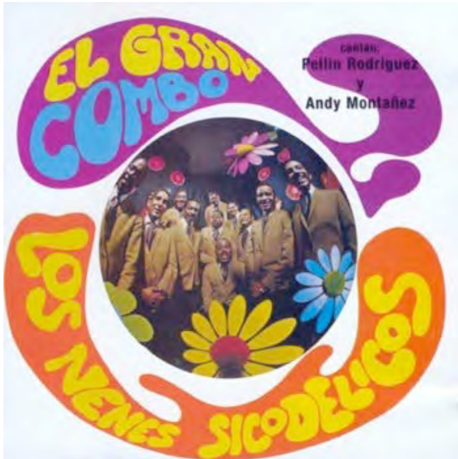
Pochette du disque Los nenés sicodelicos

No me lo explique Y dime si no te gustas el sabor del mozambique, oyé