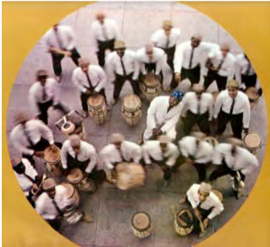
Pochette d'un disque de Pello el Afrokán

Coro del pregón Maria Caracoles baila Mozambique