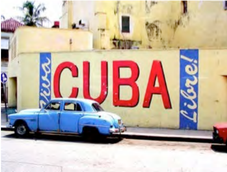
Mur de La Havane

Aquí viene mi comparsa que sigue el carnaval (bis) Ahora que Cuba es libre todos podemos guarachar Ahora que Cuba es libre todos queremos Bailar, bailar Oye ahora sí que la reforma agraria va (bis) Que está lindo ya (bis)