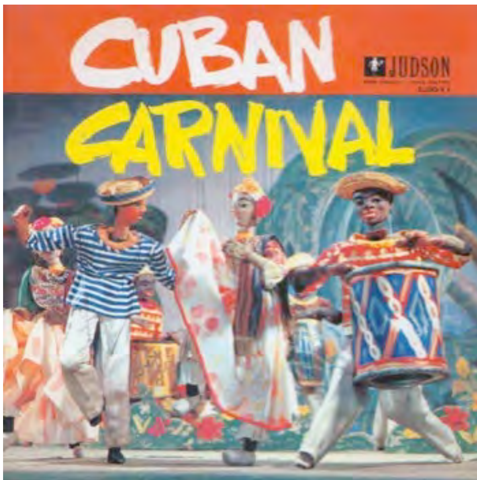
Pochette du disque Cuban Carnival , 1955, LP Judson