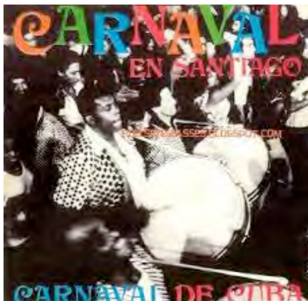
Pochette du disque Carnaval en Santiago , 1959, LP Siboney