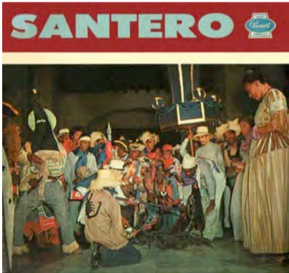
El Alacrán, disque du Conjunto Folklórico Nacional, 1947, Panart

Siembra la caña, anda ligero ( Jorge Anckermann, 1912, en la Zarzuela « La Casita Criolla » ) Comparsas Cubanas, Justi Barreto y su grupo folklórico, LP Gema 3073, 1969