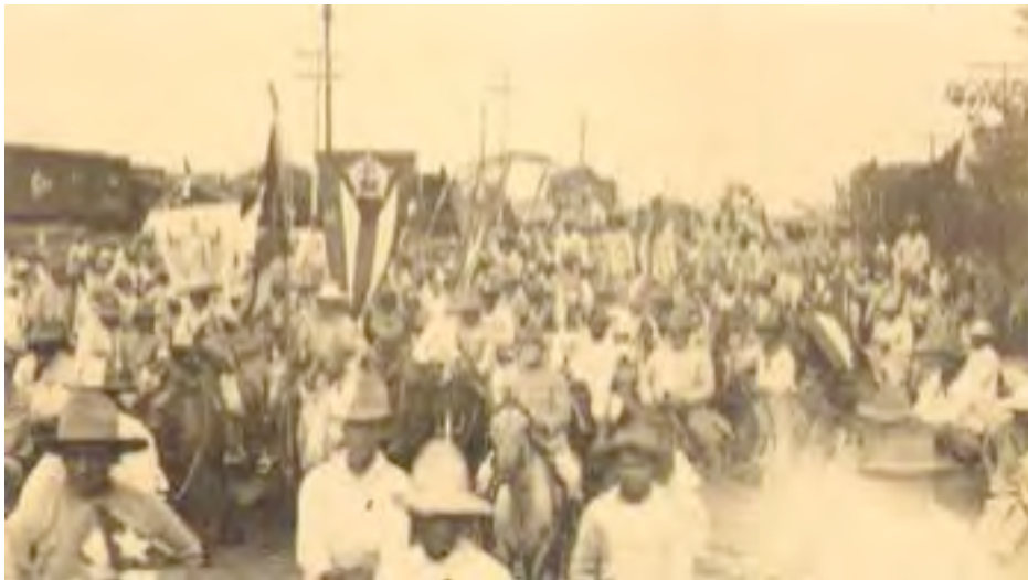
Défilé du parti liberal avec la comparsa La Chambelona, 1916, La Havane

Santo Domingo y Haití Vencieron los imposibles: Ellos comen, ellos viven Sin pagar contribución. El gobierno, la nación Los protege como hermanos, Y ¿por qué aquí los cubanos Pagamos contribución?