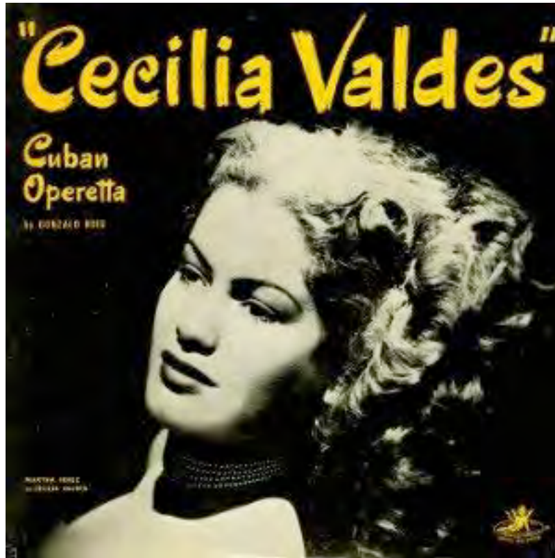
Pochette du disque de la zarzuela Cecilia Valdés

Avec l'engouement populaire pour les airs de rue des congas et des comparsas, les lieux de danse (cabarets, casinos) s'approprient leurs mélodies dès les années '20. On s'en inspire dans tous type de formations, du trio au grand orchestre (conjunto de casino). Le marché du disque fait alors connaître internationalement ce nouveau style que l'on appelle la conga. Les orchestres enchaînent les tournées à l'étranger. Nous trouverons alors des congas enregistrées sur disque dans plusieurs capitales du monde, sous des titres ou des paroles parfois exotiques (en français, anglais, russe, créole..