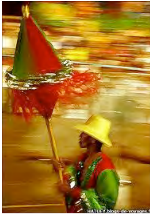
Farola dans le carnaval à La Havane