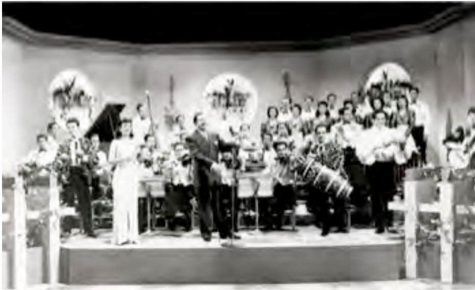
Xavier Cugat Orchestra

En sus serenatas Solo cantan sus amores Dicen cantando a la amada Su amor Arollando, arollando (bis)