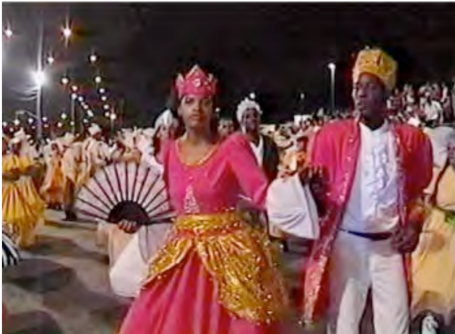
Comparsa de Atares