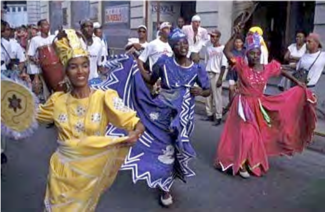
Défilé de la Carabalí Isuama

Les comparsas carabalí de Santiago de Cuba sont des formations de défilé trouvant leur origine dans les cabildos de nación (sociétés d'entraide de Noirs d'Afrique regroupés par ethnies). De nos jours, il ne reste plus que deux formations dans le carnaval santiaguero, les Carabalí Isuama et Carabalí Olugo . Leur orchestration comprend des grosses caisses, cloches, hochets en osier. De nos jours, le chœur n'est pas annoncé par un instrument mélodique, mais par un chanteur soliste. Les chants font parfois référence à l'histoire de la carabalí (les mambises par exemple), mais aussi des sujets politiques ou religieux (citations de dieux africains). On y trouve également beaucoup de citations à l'Afrique, éden perdu et identité revendiquée.