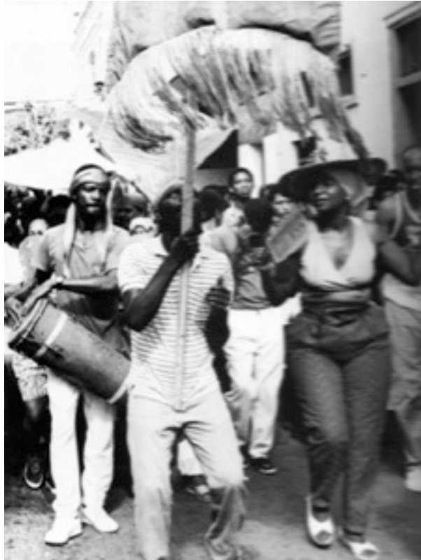
Bocú et farola, carnaval de La Havane