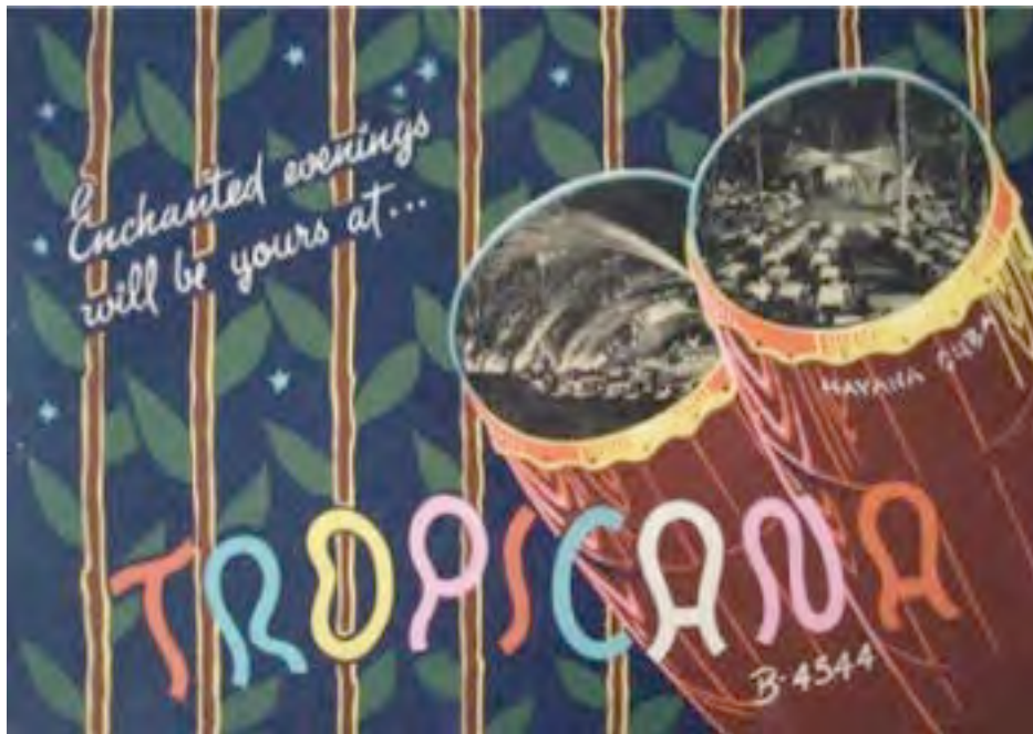
Cabaret Tropicana de La Havane