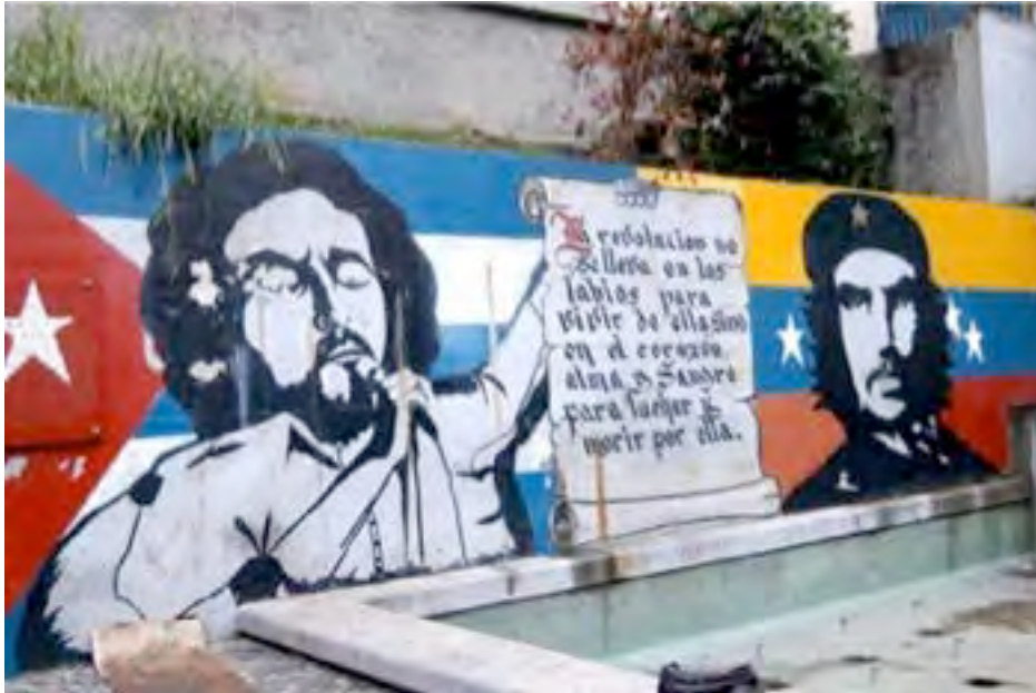
Mur de La Havane