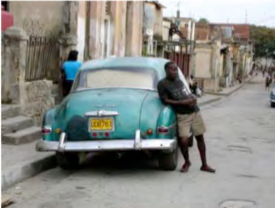
Barrio de Santiago (Los Hoyos)