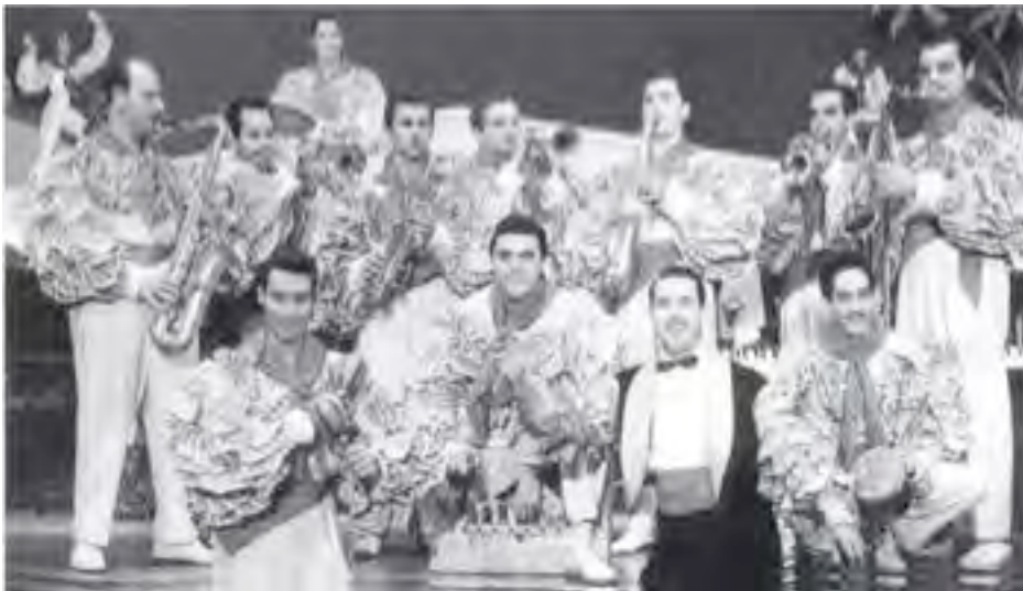
Lecuona Cuban Boys

Mi negra vamos detrás Que la conga no vuelve más Para Vigo me voy Mi negra dime adiós Anda bongocero toca ya Que estoy medio loco por bailar Para Vigo me voy, me voy, me voy Mi negra dime adiós Mira que la Conga ya se va Para nunca más volver a sonar Para Vigo me voy Mira que la Conga ya se va Para nunca mas volver Para Vigo me voy