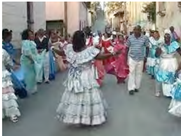
Défilé de la Carabali Olugo