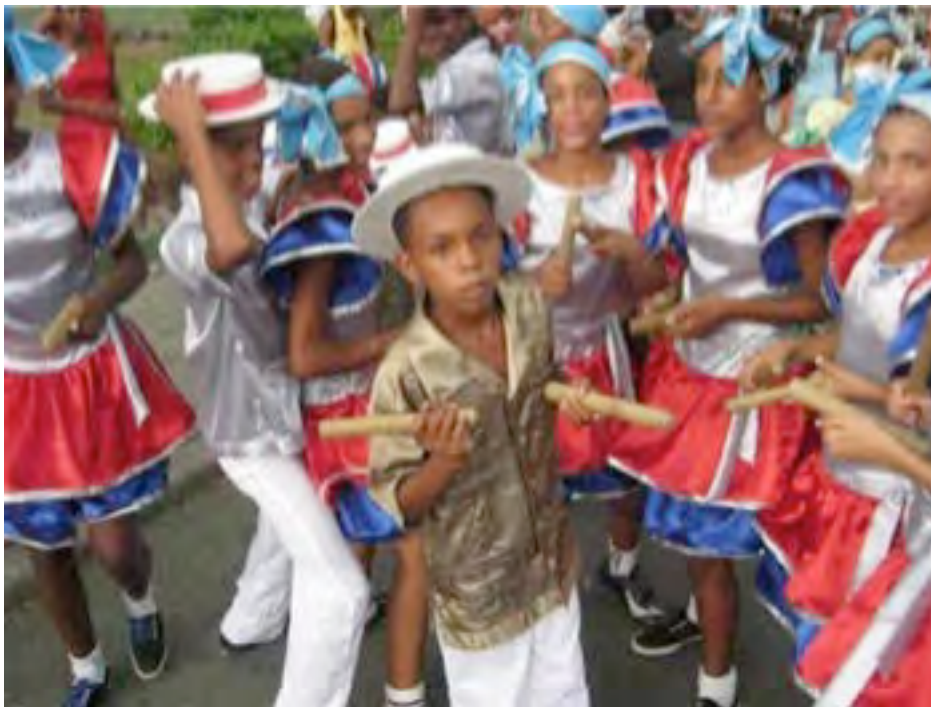
Conga infantil

Flores, flores Ahí vienen los quimoneiros Que vienen regando flores Voy a bailar voy arrollar Con La Quimona