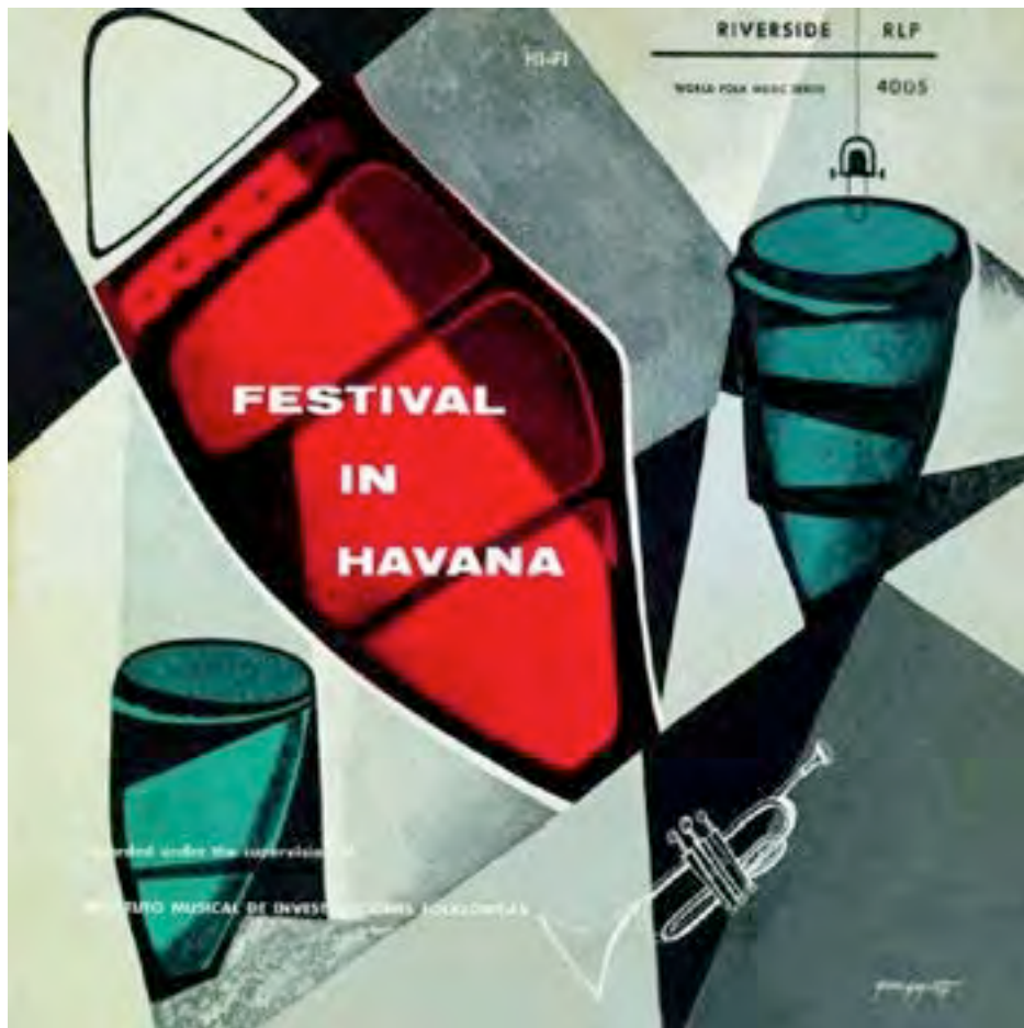
Pochette du disque Festival in Havana , 1955, LP Riverside

Si tu vienes a la Bollera que bonito esta Por mi madre te lo ocurro no le falta nada No le falta nada (bis)