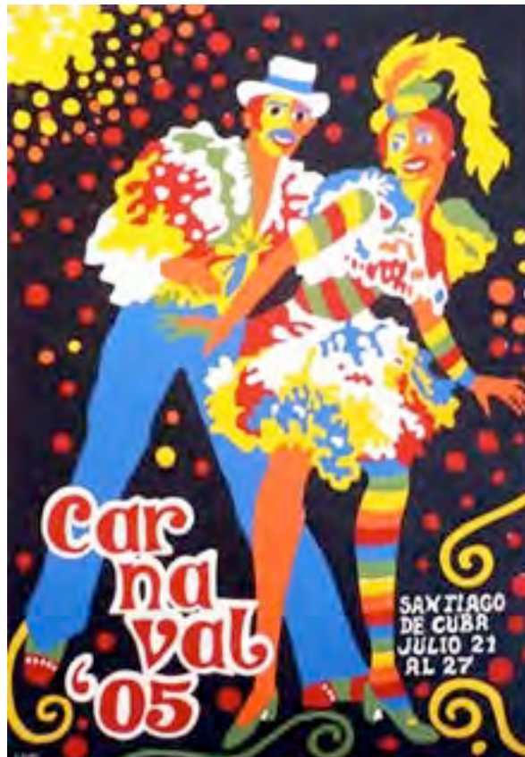
Affiche du carnaval 2005 de Santiago de Cuba