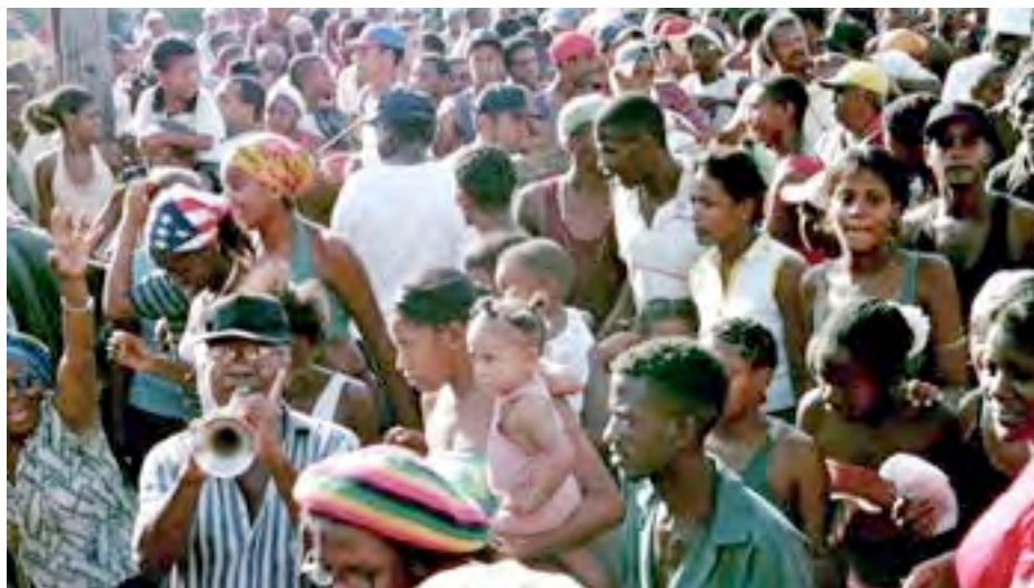
Invasión de las congas, Guarani à la corneta china