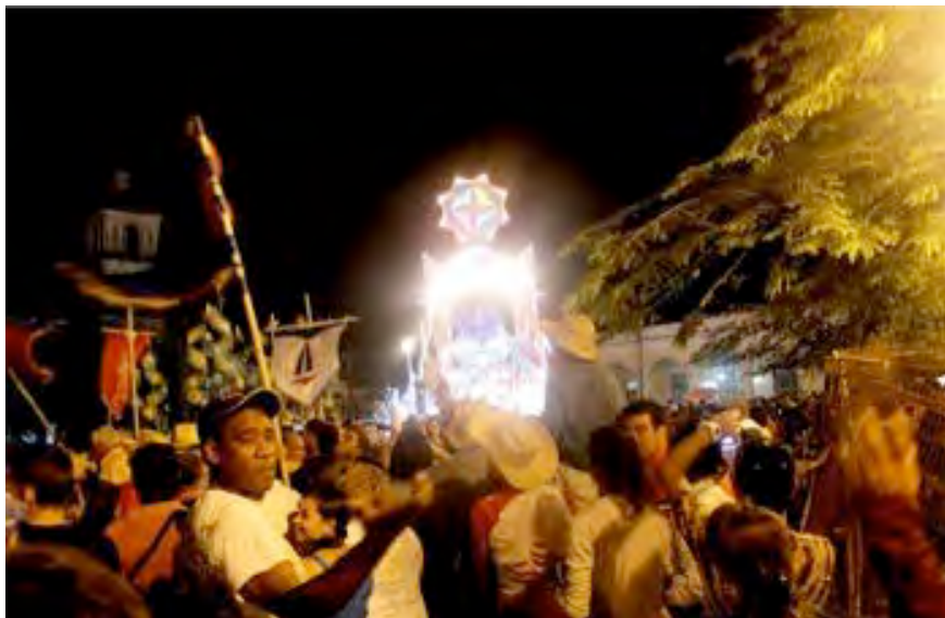
Parranda de Remedios