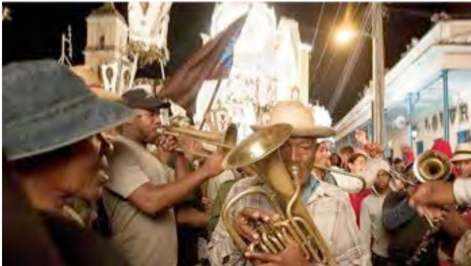
Parranda de Remedios

(en hommage au trompettiste Perico Morales) Ahí viene Perico con su cornetín Todos los de Carmen Tienen que morir