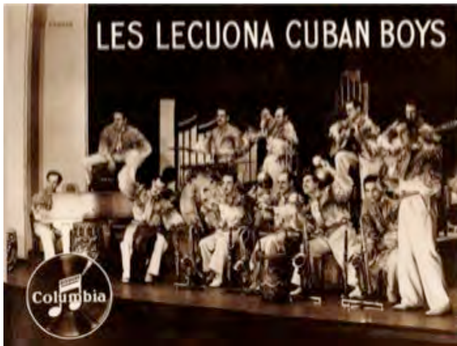
Lecuona Cuban Boys