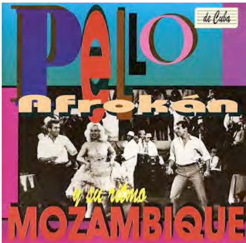
Pochette d'une réédition d'un disque de Pello el Afrokan