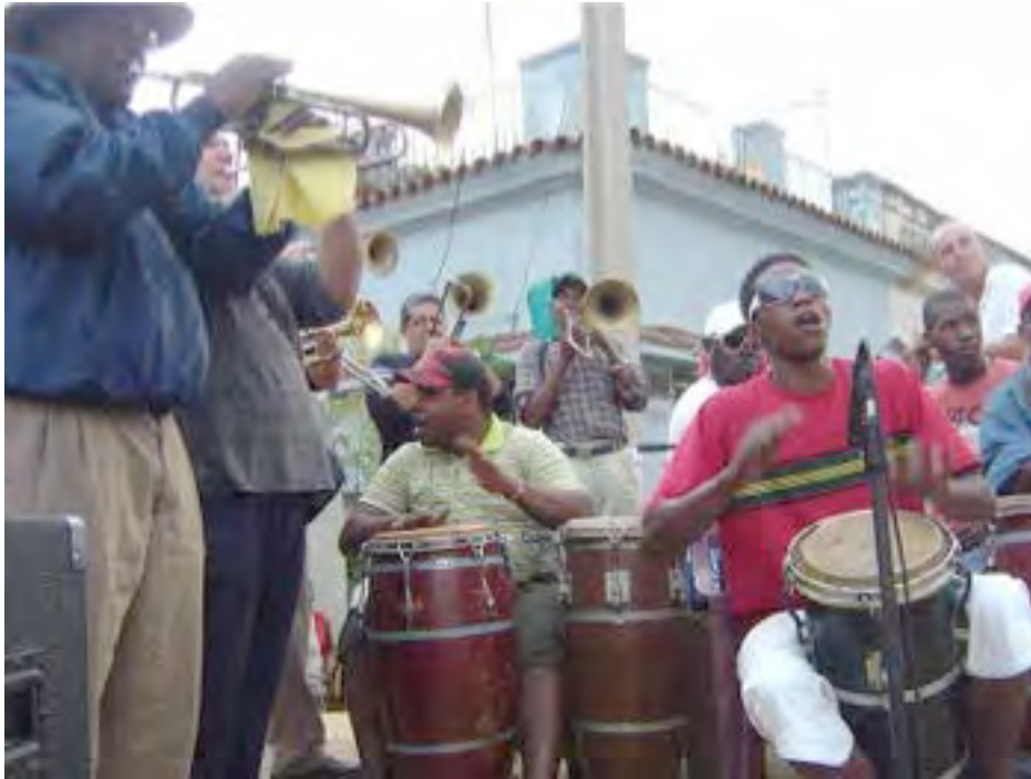
Charanga Santiago de Las Vegas

Bejucal (ou San Felipe et Santiago de Bejucal) est une ville proche de La Havane, rattachée à la province de Mayabeque. Ses charangas font partie des manifestations carnavalesques importantes de l'île, avec ses chars, feux d'artifices et troupes de défilé. Les groupes musicaux les accompagnant sont appelés charanga ou conga. Ce sont des fanfares avec cuivres (trompettes et trombones) et percussion (tumbadoras, grosses caisses, cloches).