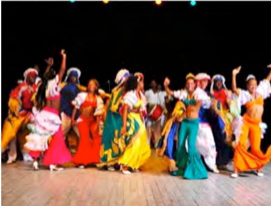
Ballet folklorique Cutumba