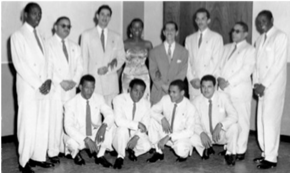
Celia Cruz et la Sonora Matancera

Abre la puerta querida Abre, abre, abre Que te traigo un regalito Lindo, lindo, lindo Abre la puerta querida Abre, abre, abre Que te traigo una cosita Rica rica rica